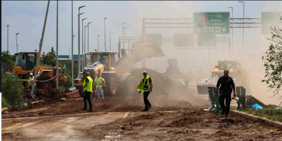
A l'extérieur de l'aéroport israélien Ben-Gourion après un tir de missile lancé du Yémen, le 4 mai 2025.